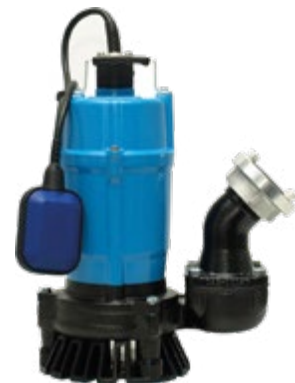
Pumpen-Prüfung nach DGUV 3