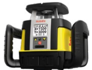
Rotations- & Neigungslaser