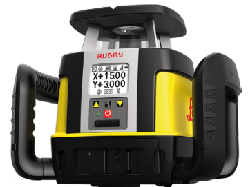
Rotations- & Neigungslaser