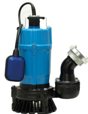
Pumpen-Prüfung nach DGUV 3