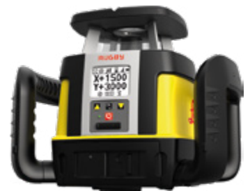
Rotations- & Neigungslaser