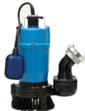
Pumpen-Prüfung nach DGUV 3