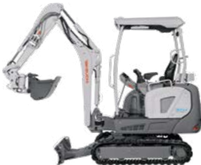
oder als e-Bagger