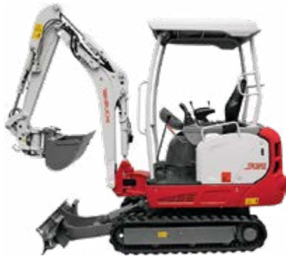
z. B. mit Schutzdach

Auch in weiteren Ausführungen erhältlich: