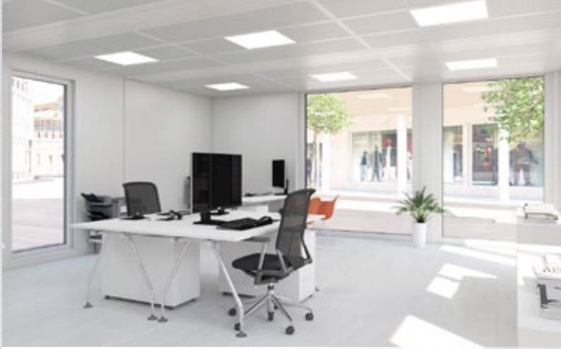
→ Helle Räume dank Vollverglasung