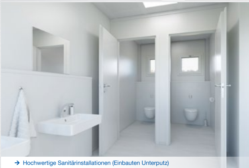
→ Hochwertige Sanitärinstallationen (Einbauten Unterputz)