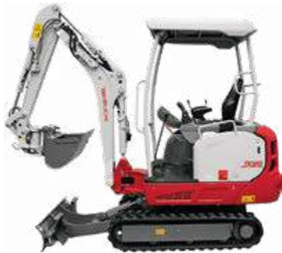
z. B. mit Schutzdach

Auch in weiteren Ausführungen erhältlich: