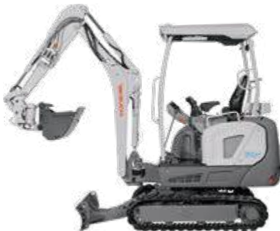
oder als e-Bagger