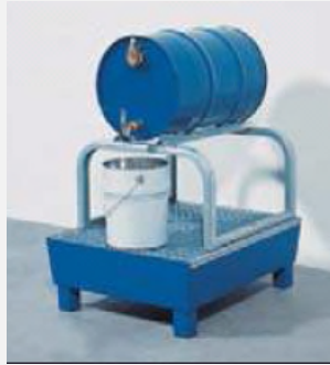
Abfüllung mit Faßbock

system. Insbesondere ist eine liegende Abfüllung mit Faßbock und Füllanzeige ODER Pumpe mit Schlauch < 0,5 m sowie selbstschließendem Zapfventil zu empfehlen.